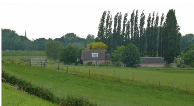
Territorium bij de kazemat Vreeswijk-Oost gezien vanaf de Lekdijk-Oost.

Rijkswaterstaat en Steenuilenwerkgroep De Limes hebben de samenwerking met een overeenkomst bezegeld. Met de uitvoering van deze activiteiten kan de steenuil zich - ook na de aanleg van de 3e kolk Prinses Beatrixsluis - goed rond Tull en 't Waal handhaven.